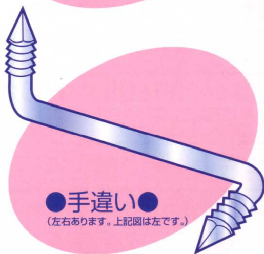
●手違い● (左右あります。上記図は左です。)