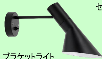
ブラケットライト