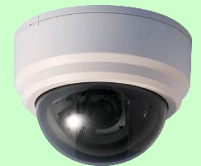
セキュリティ機器