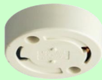
照明のベース器具 (引掛けシーリング)