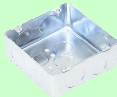
アウトレットボックス