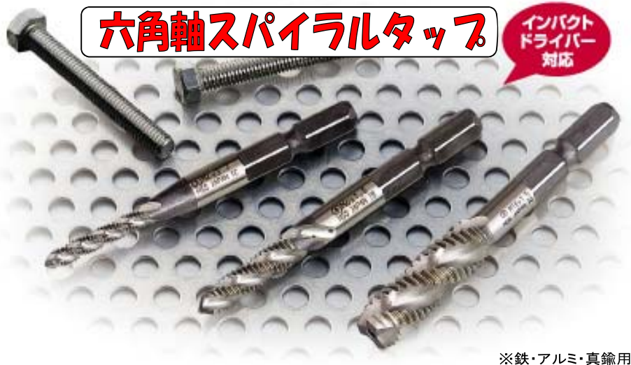
※鉄・アルミ・真鍮用