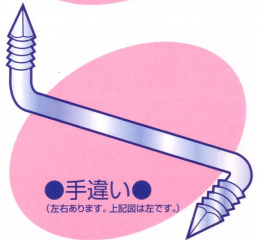
●手違い● (左右あります。上記図は左です。)